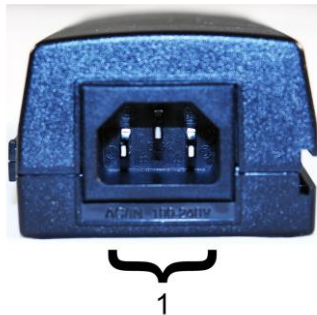
Рис. 2. Инжектор Midspan-1/190A, Midspan-1/300A Midspan-1/300G, вид сзади