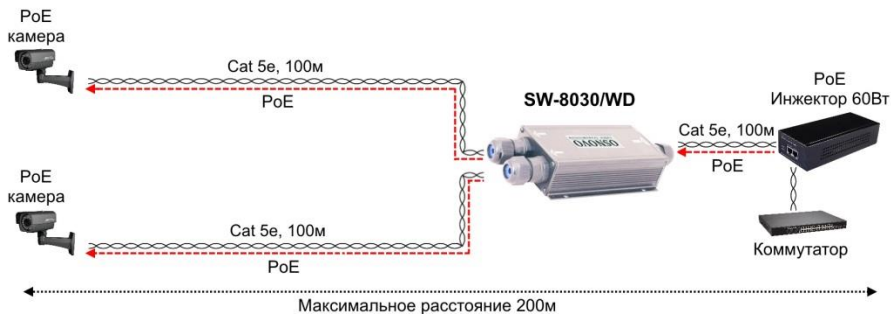
Рис.3 Типовая схема подключения коммутатора/удлиителя SW-8030/WD