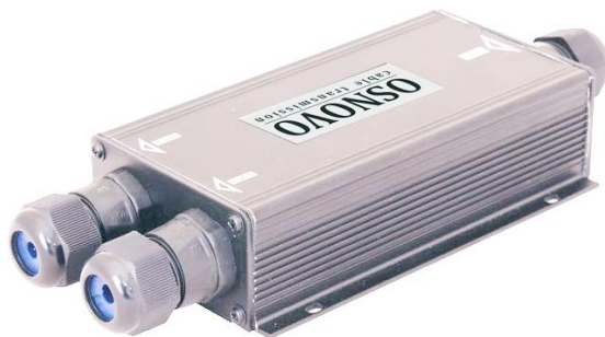
Рис.1 Коммутатор/удлинитель SW-8030/WD, внешний вид, вид со стороны гермовводов