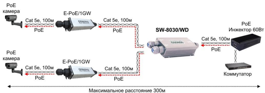
Рис.4 Схема подключения коммутатора/удлиителя SW-8030/WD вместе с удлинителем E-PoE/1GW (приобретается отдельно)