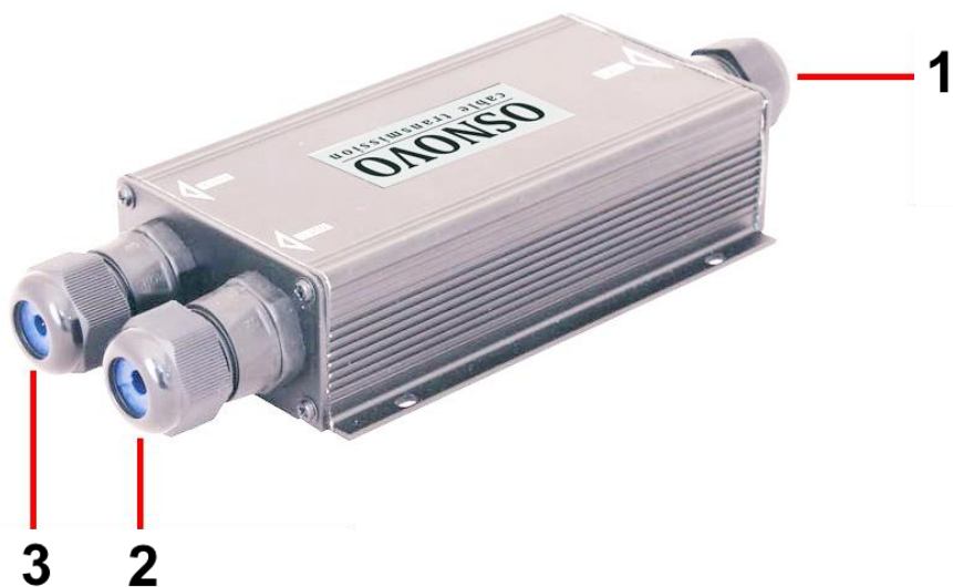
Рис. 2 Коммутатор/удлинитель SW-8030/WD, разъемы