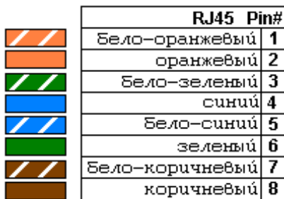
Рис. 5 Обжим кабеля витой пары («прямая», 568B)