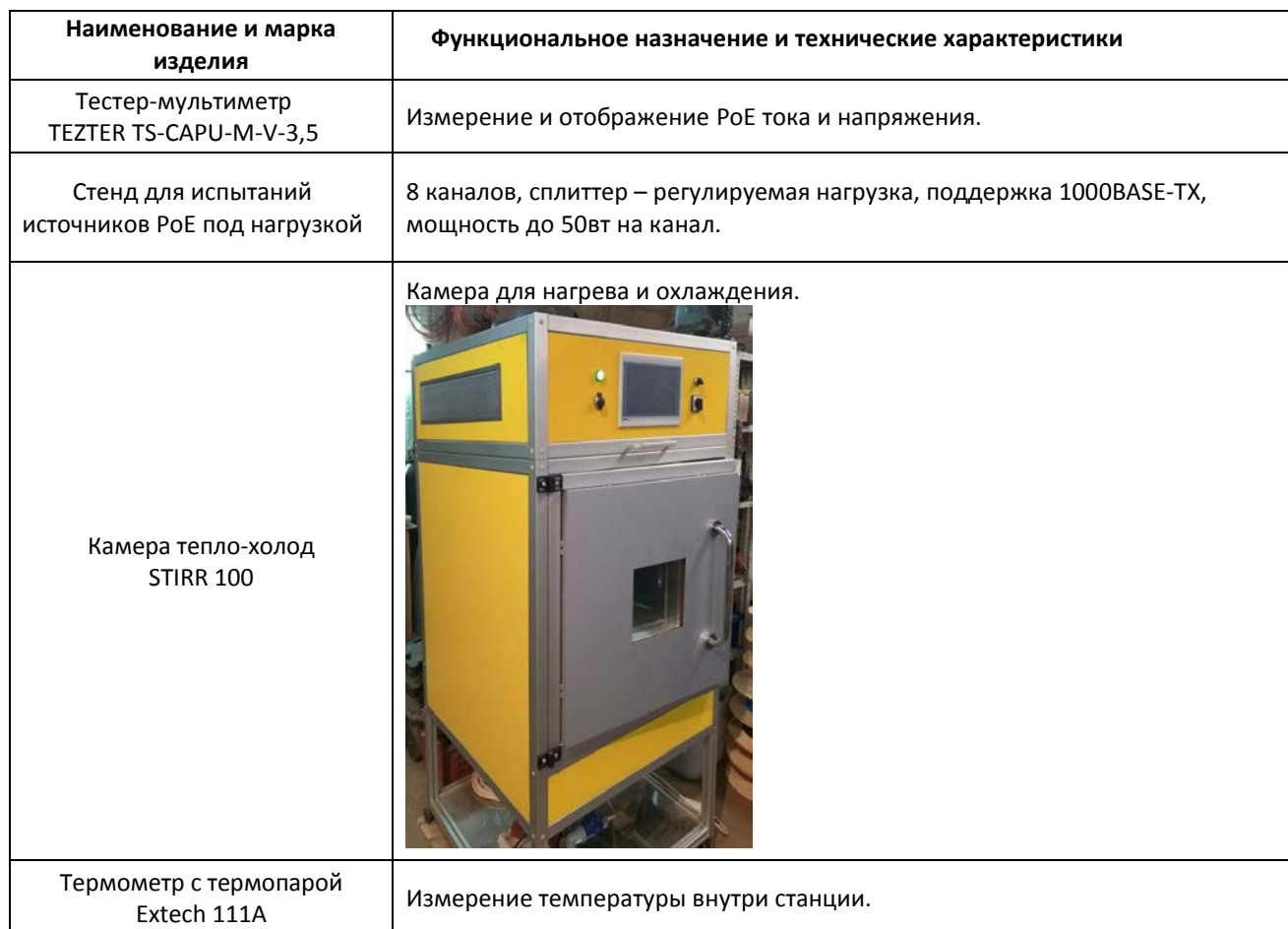
Таблица 4.1. Состав испытательного стенда