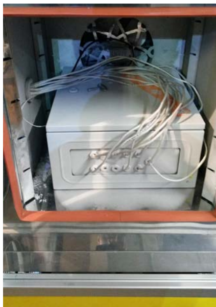
Фото испытуемой станции в камере тепла-холода: