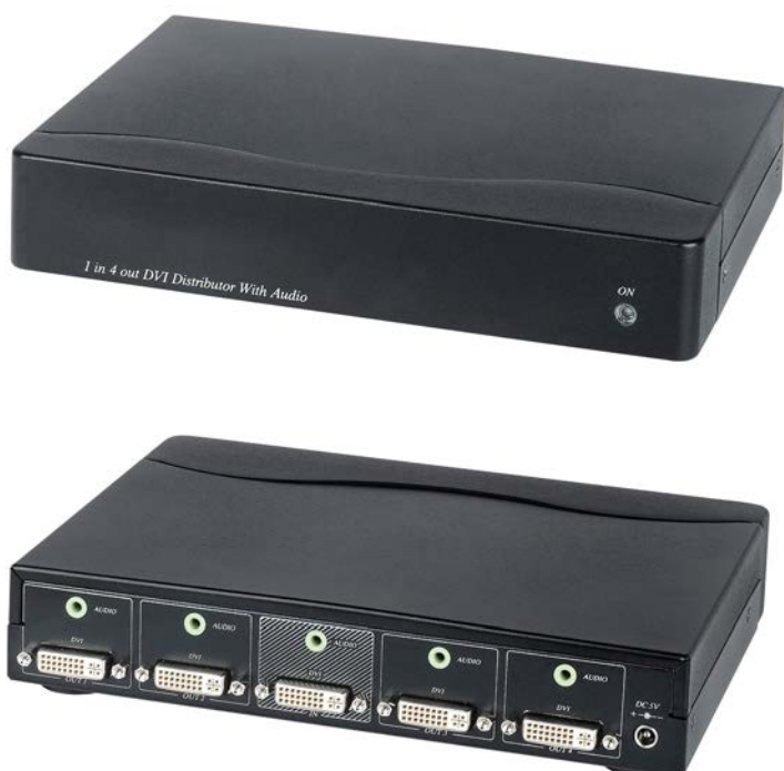
Рис.1 Внешний вид DD04A