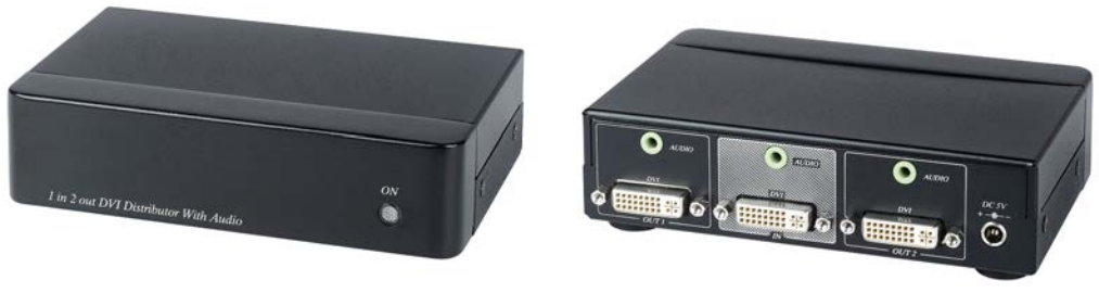
Рис.2 Внешний вид DD02A