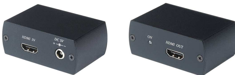
Рис.1 Внешний вид HR01