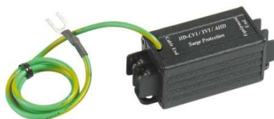
Рис. 1 Внешний вид SP009T