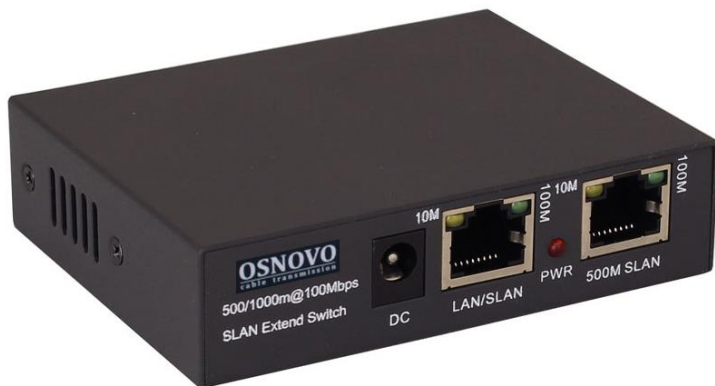
Рис.1 Удлинитель E-IP1(800м) (общий вид)