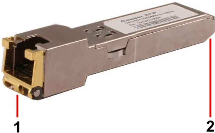
Рис. 2 SFP-модули SFP-TP-RJ45, SFP-TP-RJ45/I, разъемы