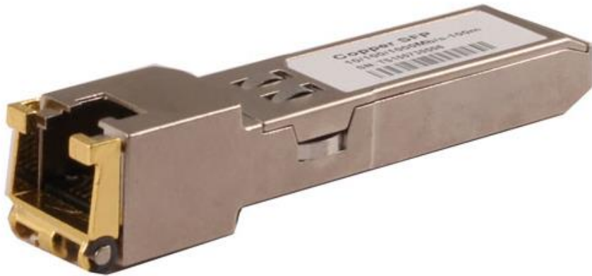
Рис.1 SFP-модули SFP-TP-RJ45, SFP-TP-RJ45/I, внешний вид